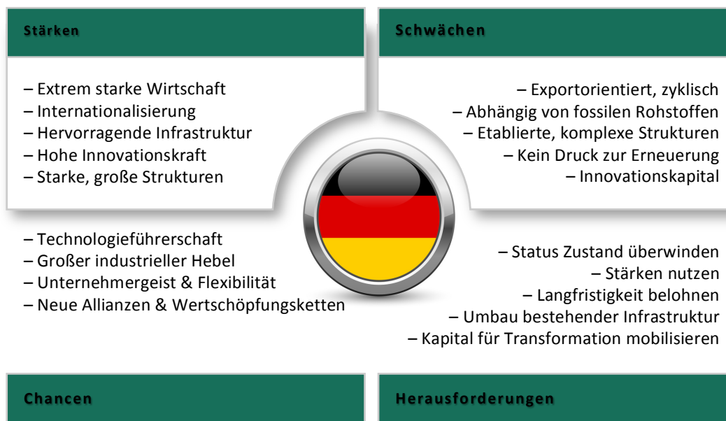
Abbildung 2: SWOT-Analyse der deutschen Wirtschaft in Hinblick auf Bioökonomie

Für ein rohstoffarmes Land wie Deutschland ist die stete Erneuerung der industriell-technischen Basis ein kritischer Erfolgsfaktor. Die Zukunftsfähigkeit des derzeitigen Geschäftsmodells, das vor allem auf dem Verkauf von Limousinen und Maschinen beruht, ist im Hinblick auf die doppelte Abhängigkeit von fossilen Ressourcen – als Treibstoff und als Produktionsgrundlage – zu hinterfragen. Der ökologische Umbau der deutschen Industrie ist eine umso größere Herausforderung, als dass hoch vernetzte, derzeit gewinnbringende und effiziente Strukturen scheinbar ohne Not aufgebrochen werden müssen. Für eine ökologische Transformation gilt es daher, gesellschaftliche Akzeptanz durch politische Unterstützung zu erzeugen sowie unterstützende Wirtschaftsbereiche wie etwa den Kapitalmarkt für den wirtschaftlichen Wandel zu sensibilisieren.